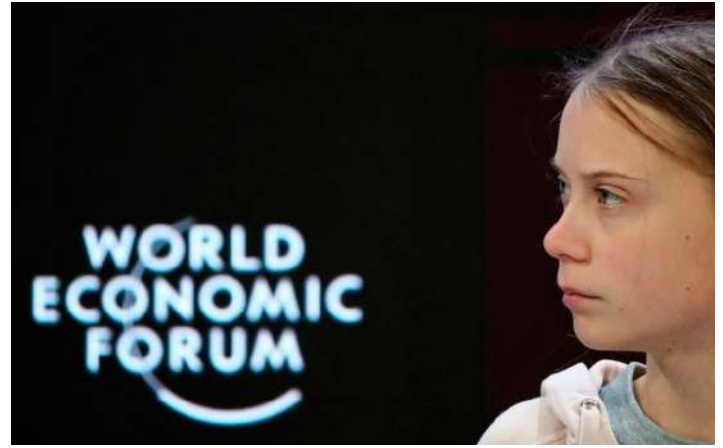
Figura 1.2: Ativista Greta Thunberg fala em painel do 50º Fórum Econômico Mundial, em Davos, Suíça.

Também participou da programação oficial de apresentações a jovem ativista ambiental sueca Greta Thunberg, conhecida por afirmar que o sistema atual representa uma traição às gerações futuras por seus graves danos ambientais implícitos. Ao discursar, Greta demonstrou uma maior preocupação com a perenidade dos negócios, destacando a importância da sustentabilidade no viés socioeconômico. Ainda nesse sentido, vale observar que, pela primeira vez em dez anos, as alterações climáticas figuraram entre os cinco maiores problemas citados por CEOs, de acordo com o relatório anual de riscos globais do Fórum.