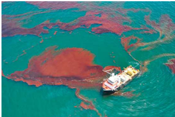
Figura 1.3: Desastre ambiental da BP no Golfo do México.