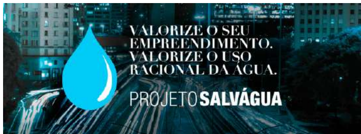
Figura 1.4: Projeto Salvágua.